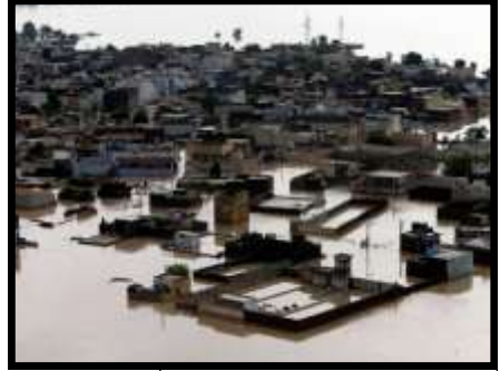
Vloede in Pakistan.

Job 12:15 Kyk, Hy hou die waters terug, en hulle verdroog; ook laat Hy hulle los, en hulle keer die aarde om.