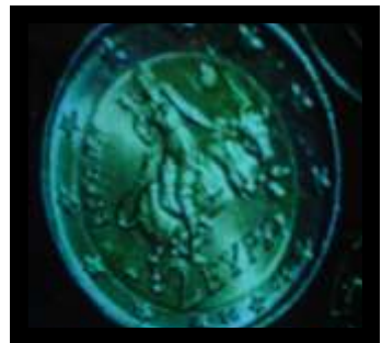
Die twee Euro muntstuk met die vrou op die bees. (Open 17)