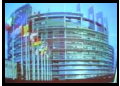
Die parlamentsgebou van die Europese Unie in Frankryk, gemodelleer op die antieke toring van Babel. In gebruik geneem in die jaar 2000.