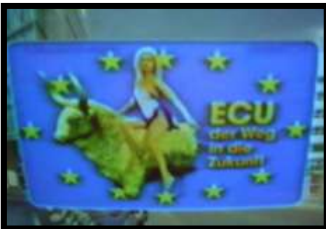
Duitse Telefoonkaart met die vrou op die bees. (Open 17)