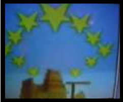
◀ Die vyfpuntster [bokkop - Satanisme] op die vlag van die Europese Unie.