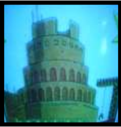
◀ 'n Kunstenaar se skets van die antieke toring van Babel.

Twee van die simbole wat tans in Europa verskyn is die van die toring van Babel en die vrou op die bees. (Open 17)